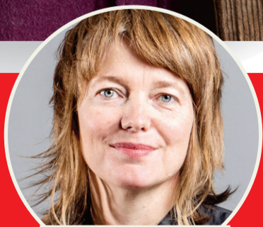
Malin Björk EU-parlamentariker (V)

"Vänsterns inflytande i EU bygger på samarbeten med folkörelser utanför parlamenten"