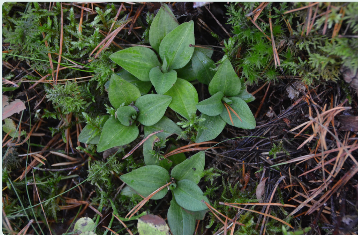
Bild på knärot som är en fridlyst orkidé som finns i Tyresö.

En stark vänster i EU är viktig för Tyresös arbete för en hållbar utveckling.